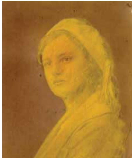
Medusa mit Baskenmütze

Nicht zu vergessen die chinesische Mäuse!, (das Pärchen, das in den Taschen von den beiden Mandarinen war), also, dass die Mäuse wider Willens der Mäuse geklaut wurden von Boltzmanns Farm. Und davon sicherlich farbige Mäuse entstanden sind, also später. Vor der alte Mause trau; das T. von der man reden kann, ist nicht das ewige trau bitte! Mäuse haben damals gesagt, das zwischen eine grundlegende Begrifflichkeit, die wir vielleicht in die dreidimensionale Welt zu verstehen kann. Im