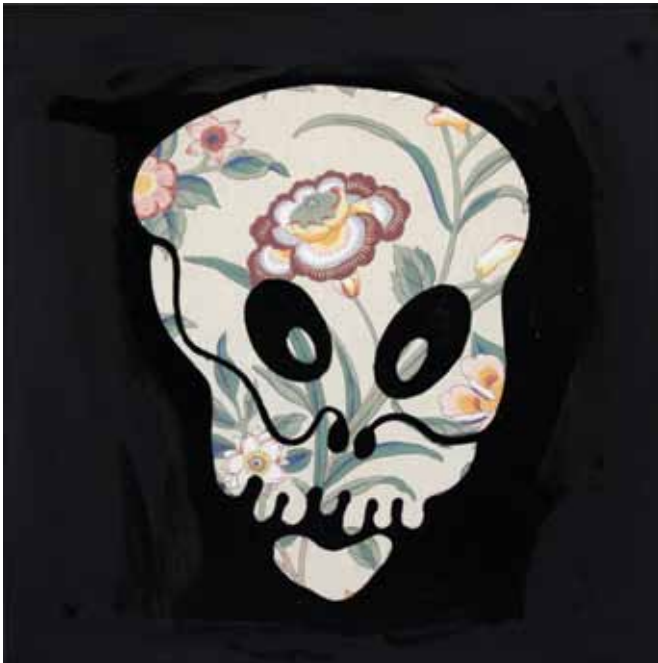
Beispiel allgemeiner Gehirnschlamasselschädel mit Blumen

Tatsache unterrichten uns die Mystiker und die Gehirnschlamasselisten gleichermaßen und die Mäuse, die Wirklichkeit lässt sich zwar durch geeignete und lang geübte Meditationsmethoden in ihrer undifferenzierten Natur erfahren, aber es lässt sich nicht über Serien, außer und nur auf indirekter Weise verstehen.